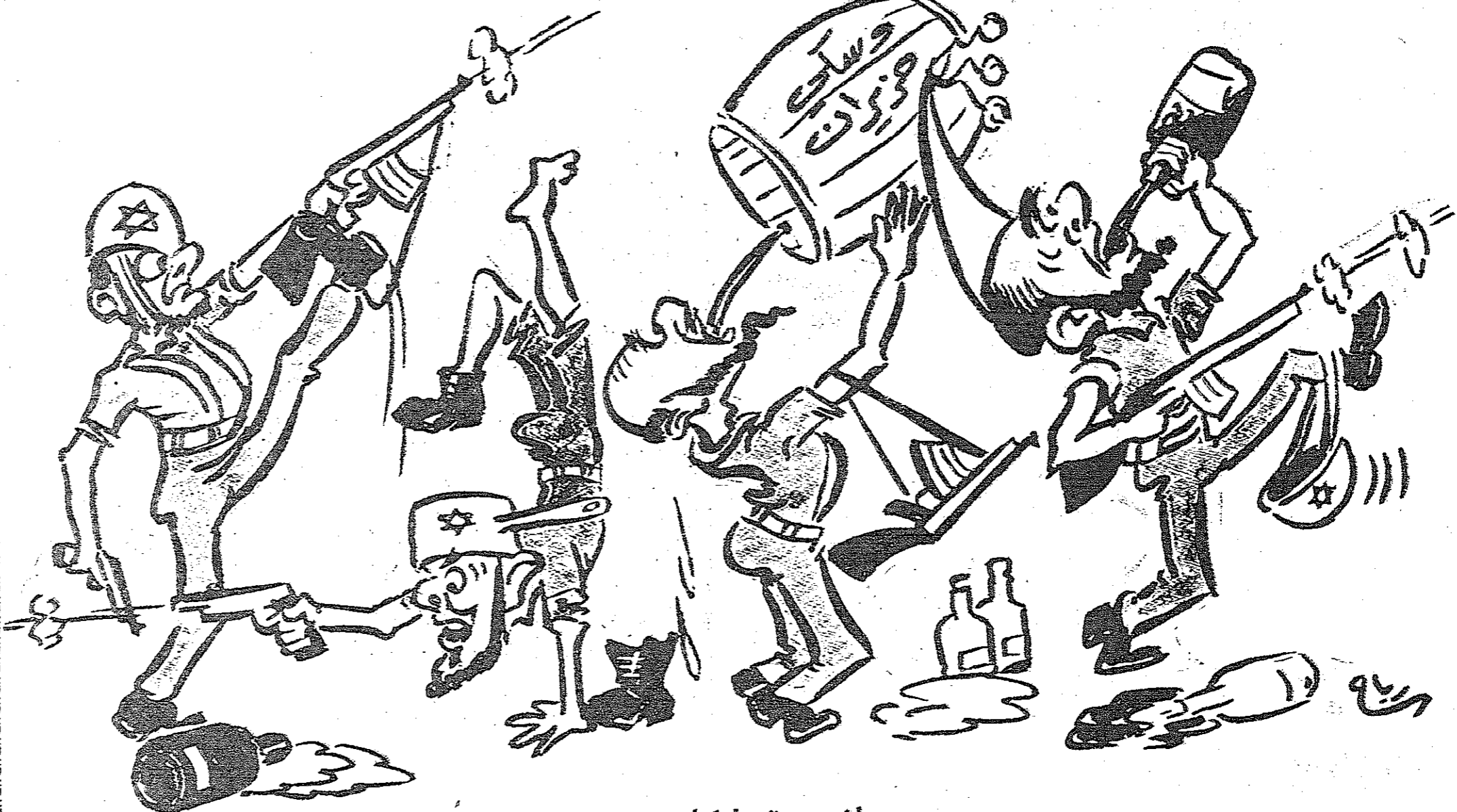
آخر صورة «لحكاء» صهيون!